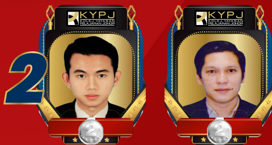
TEAM MULTIMEDIA KYPJ