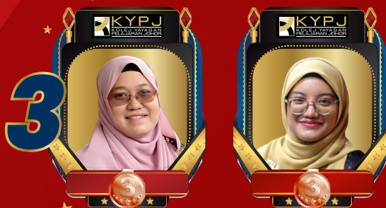
TEAM HEP KYPJ